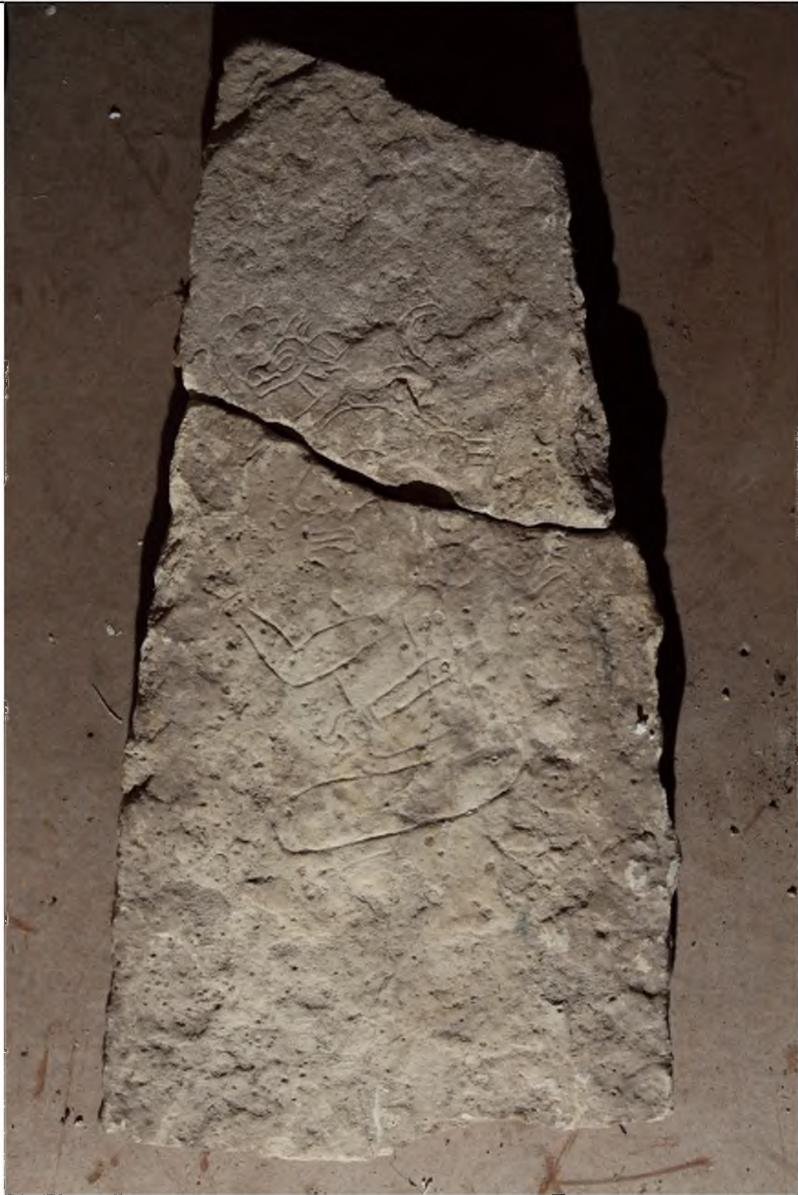
Monumento inciso, procedencia desconocida, frente.