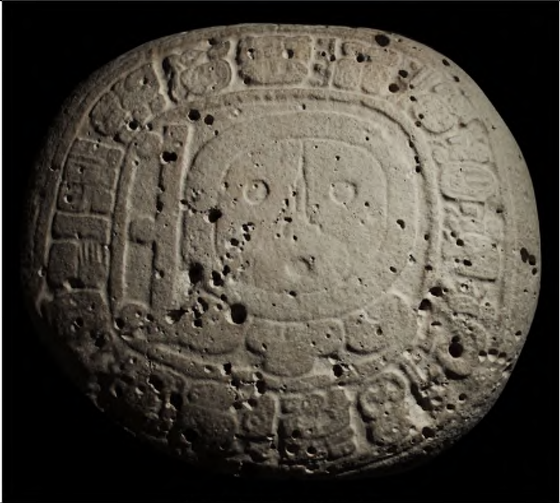
Altar 14 de Tikal.