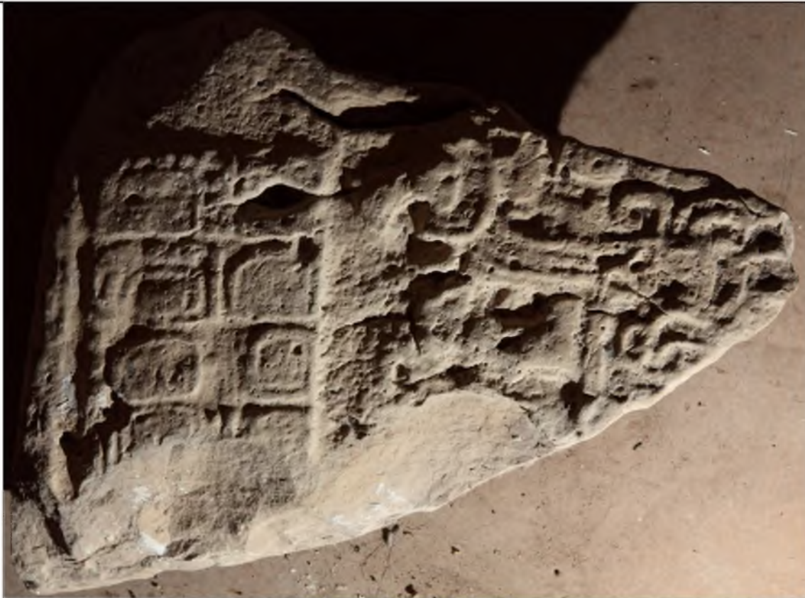
Estela fragmentada, fragmento con Serie Inicial, bodega del Museo de Cerámica Sylvanus Morley.