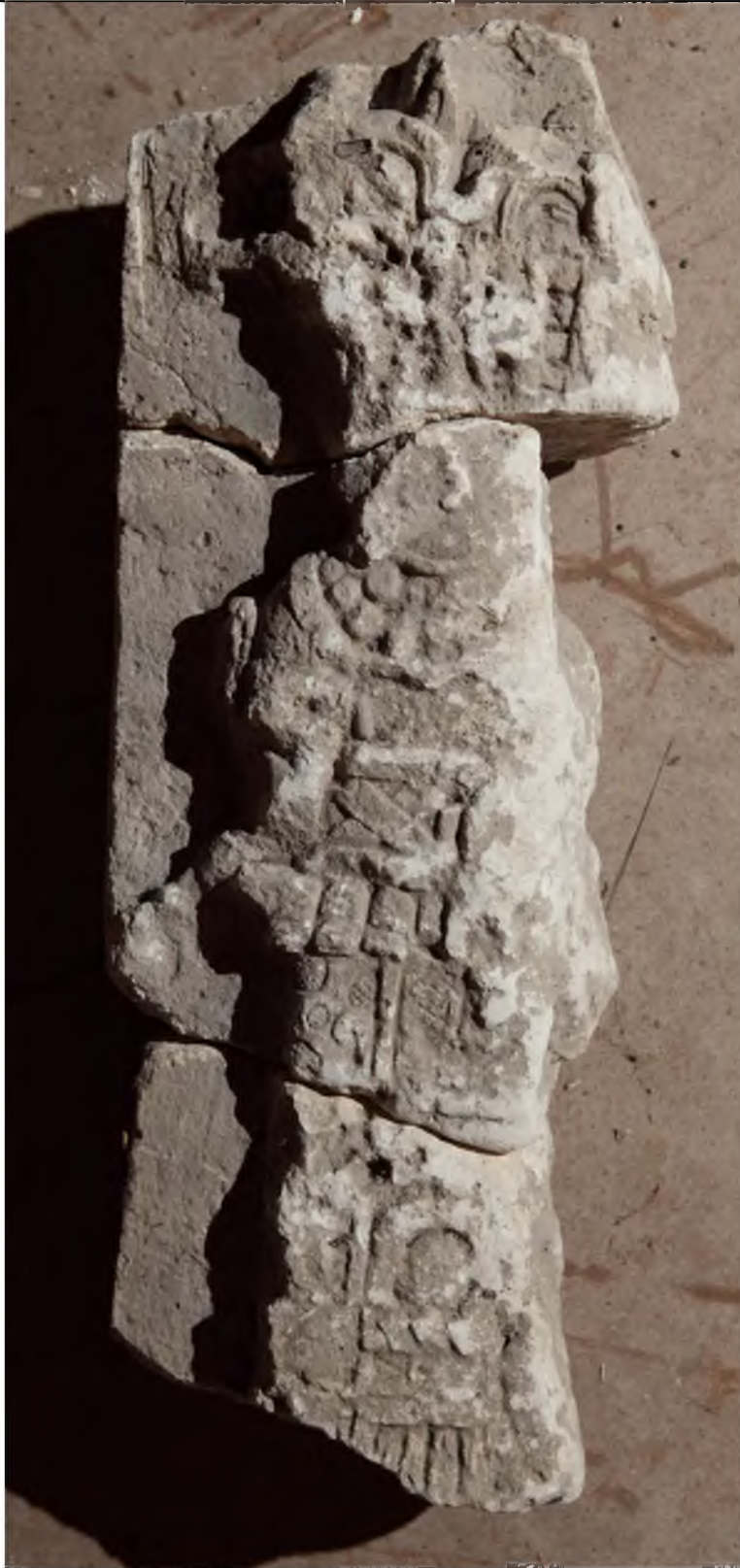
Fragmento de la estela, procedencia desconocida, frente.