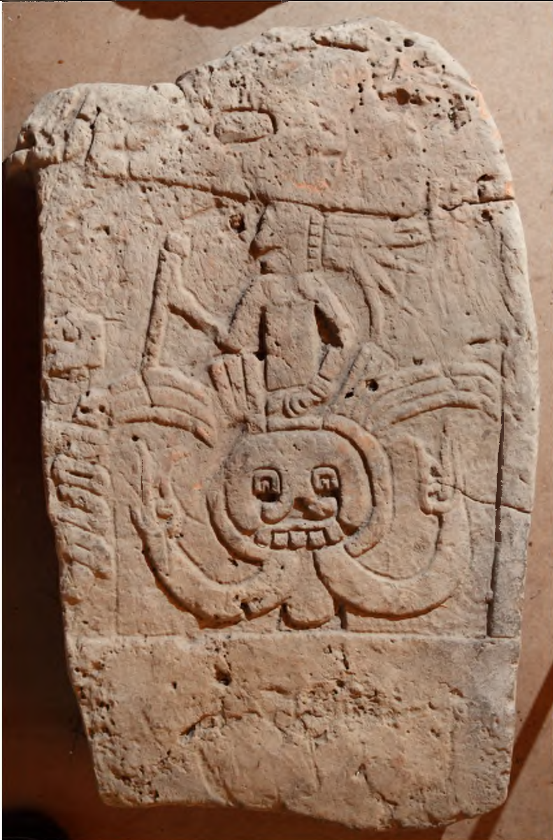
Monumento sin procedencia, bodega del Museo de Cerámica Sylvanus Morley.