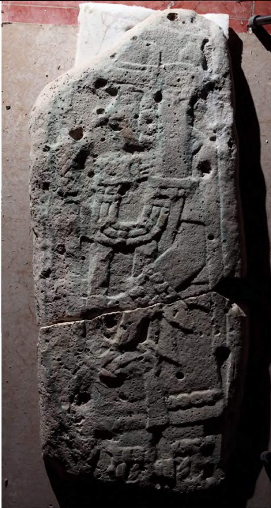
Estela 7 de El Zapote, frente.