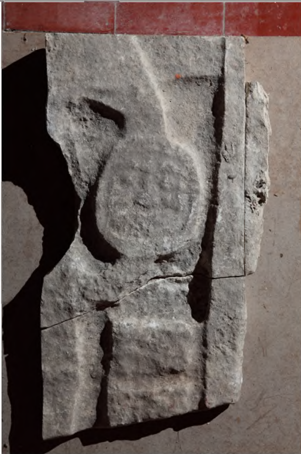
Fragmento de estela, procedencia desconocida, frente.