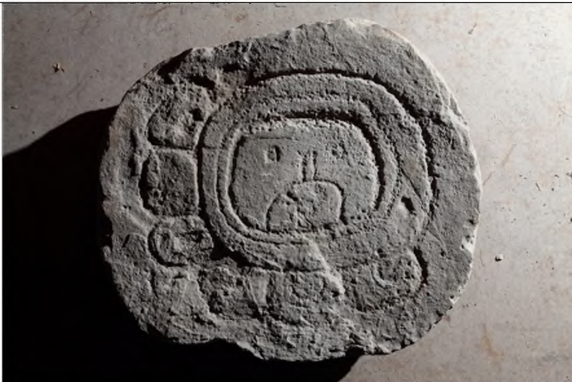
Fragmento de monumento con fecha 1 Ajaw, lado superior.