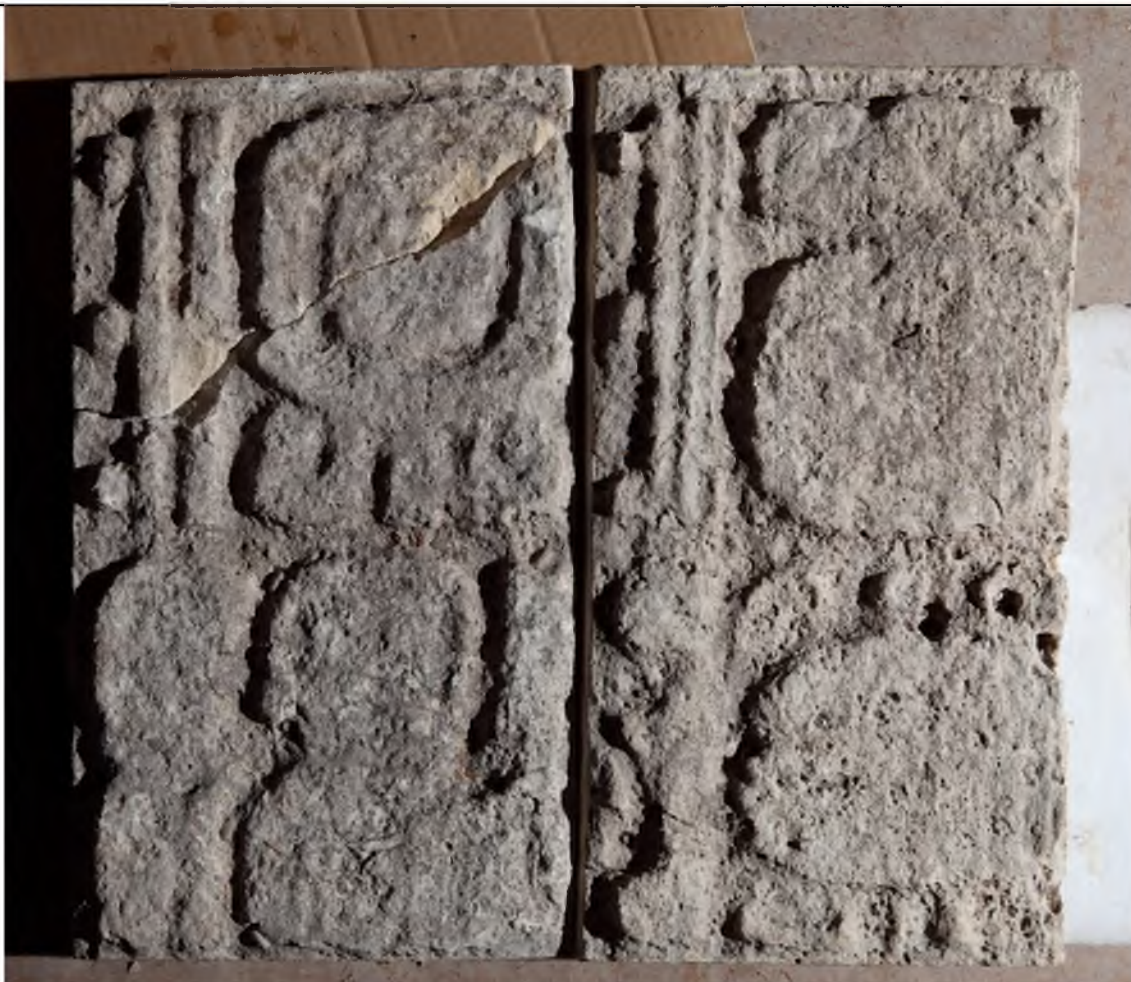
Fragmento de monumento desconocido, frente.