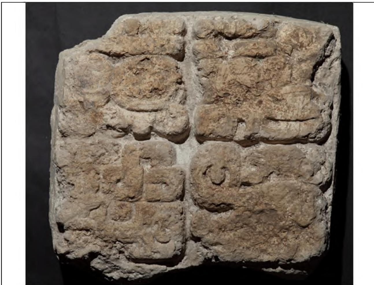
Fragmento de monumento sin procedencia, bodega de Museo de Cerámica.