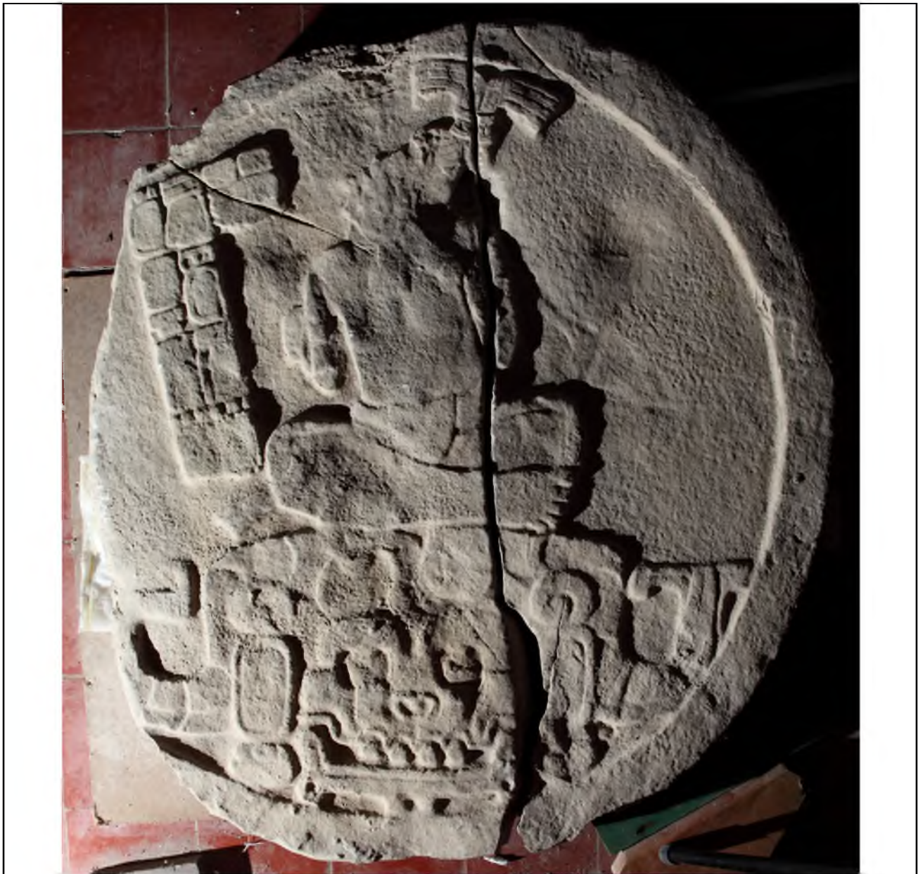
Altar de la bodega del Museo de Cerámica Sylvanus Morley, lado superior. CEMYK