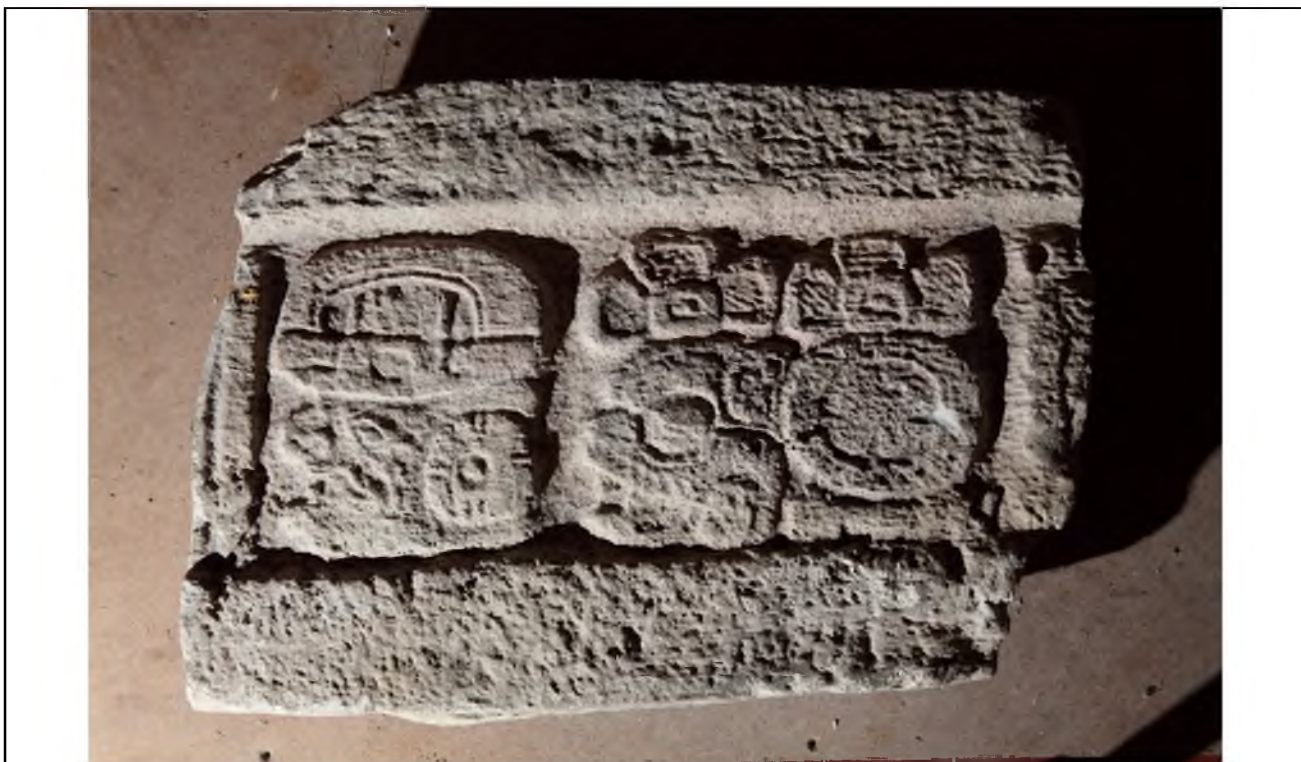
Fragmento de un monumento, bodega del Museo de Cerámica Sylvanus Morley.