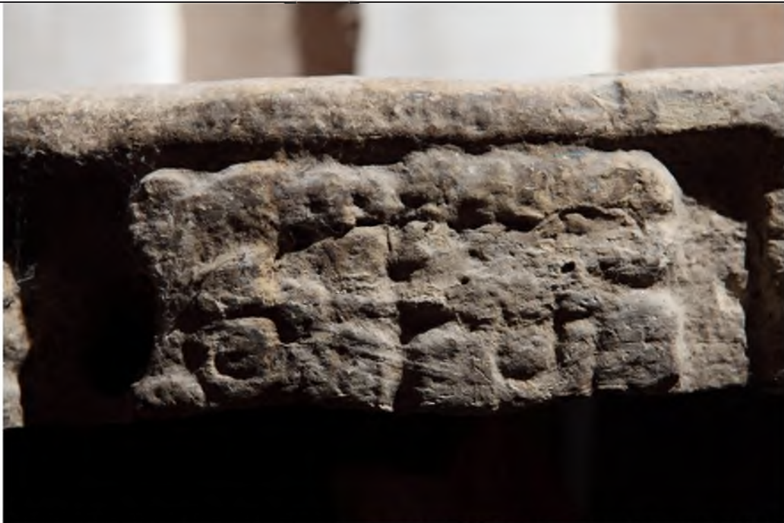
Altar de la bodega del Museo de Cerámica Sylvanus Morley, glifos en la circunferencia.